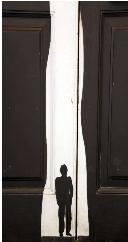
Bild: Jose Carlos Pinheiro (Bild, Detail) / arteportasabertas.com